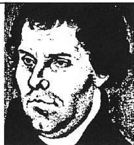
Martinho Lutero (1483-1546)