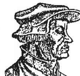
Ulrico Zuínglio (1484-1531)